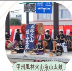
甲州風林火山塩山太鼓