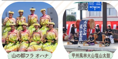
山の都フラ オハナ